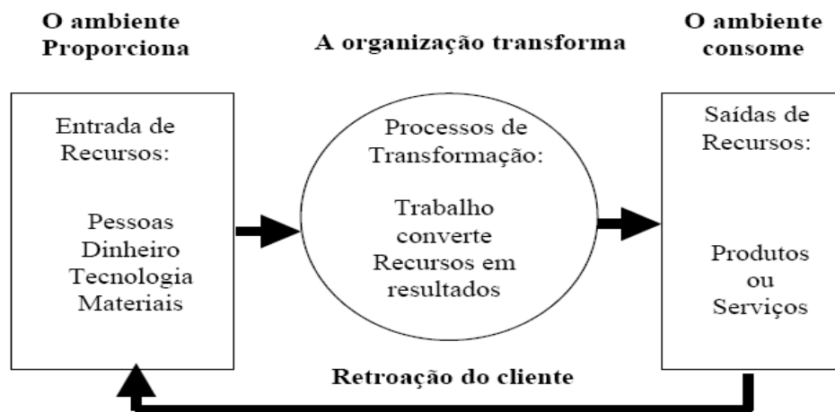
Figura 1 – Relação sistêmica ambiente interno x externo de uma organização:

“A compreensão das organizações como sistemas sociais, estruturados de forma que as relações entre diferentes elementos interagem para configurar padrões de funcionamento e processos de conhecimento nos distintos momentos produtivos da organização. ” (OLIVEIRA, 2012, p. 15). A figura a seguir ilustra como a empresa capta os recursos do ambiente externo e transforma esses recursos, através do trabalho, em produtos /serviços e os oferece aos clientes, os quais dão o feedback para a empresa, chamando de retroação.